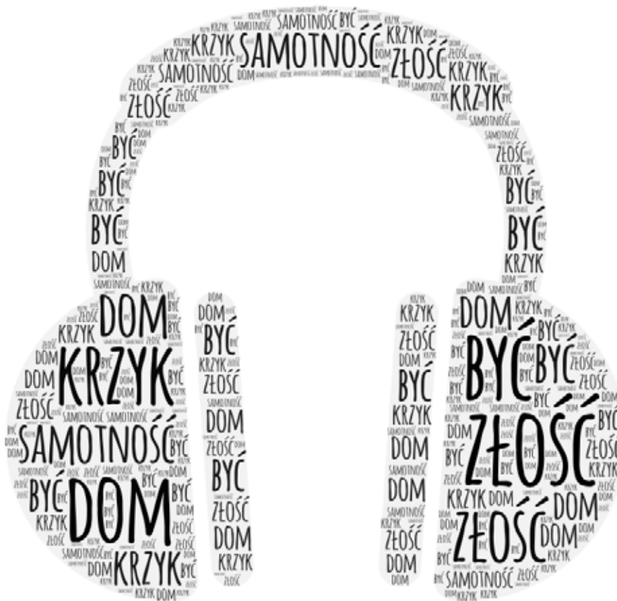
Przykład efektu pracy: Grafika pobrana z aplikacji

Poproś każdą osobę o wybranie 5 słów kluczy, które wydają jej się najważniejsze w napisanym przez siebie tekście. Mają być one sednem tekstu. Młodzież zapisuje je w formie chmury słów – za pomocą aplikacji: https://wordart.com/create lub samodzielnie tworząc takie wizualizacje w zeszytcie.